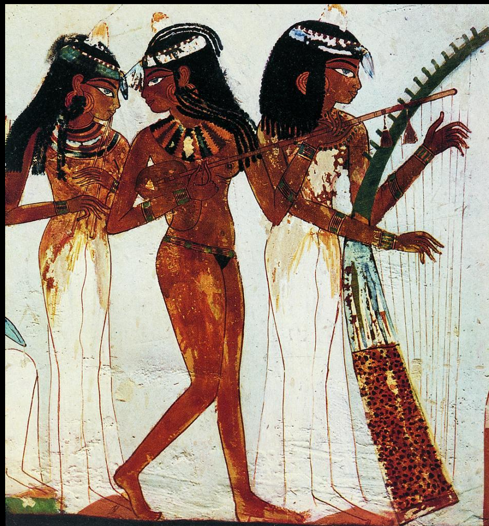
Vægmaleri Egypten 1550 f.Kr. (Den Store Danske)